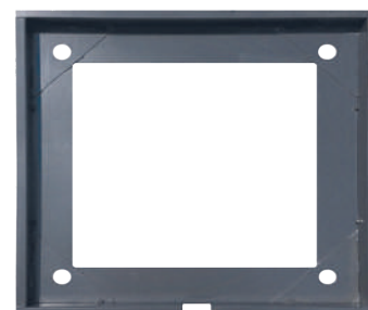
TELAIO FILO PAVIMENTO