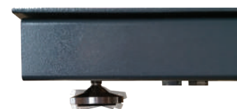
PIEDINO SNODABILE REGOLABILE