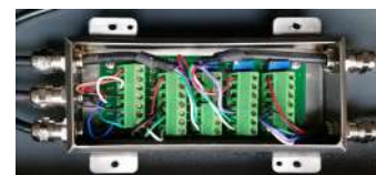
SCATOLA DI GIUNZIONE