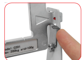
Blocco Asta del peso